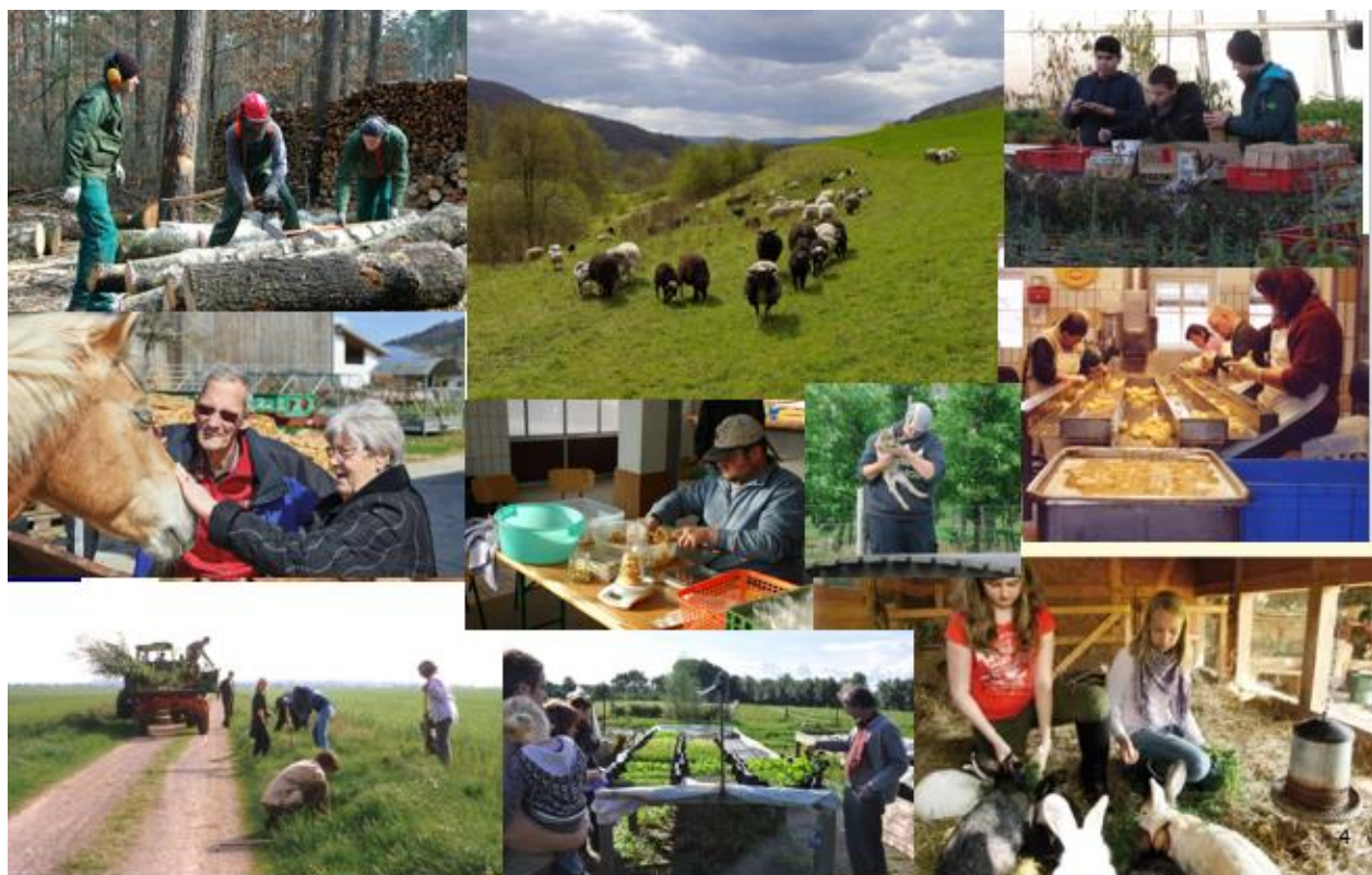
Sociální zemědělství v Německu ® PETRARCA e.V.