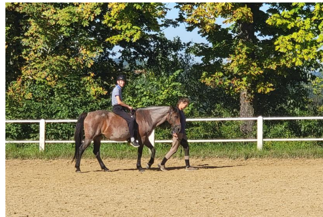
Sociální zemědělství v Polsku.

V Itálii se od roku 2000 stále více rozrůstají sociální farmy. Italské zemědělské prostředí by mohlo být pro rozvoj sociálních farem optimální. Kontakt s přírodou a zvířaty, životní styl respektující životní prostředí, klima a plody země, práce na půdě by mohla "léčit" nemoci, postižení nebo duševní, fyzické, sociální a ekonomické potíže. Sociální farma má svou úlohu: pečovat o jednotlivce, poskytovat jim zaměstnání a umožnit jim cítit se užitečnou součástí komunity. Na mnoha sociálních farmách často probíhají terapeutické činnosti, které mají zlepšit zdravotní stav lidí s postižením, autismem, ale také lidí s ekonomickými nebo sociálními potížemi. Stále více lidí by se rádo zapojilo a investovalo do sociálního zemědělství. Přesto však v systému existují určité potíže a kritické body, které v současné době sociální farmy brzdí. Závislost na veřejném financování a nejistota systému brání růstu odvětví. Rozvoj sociálních farem v Itálii omezuje také špatná spolupráce mezi sociálními farmami v rámci jednoho území a nedostatečná komunikace.