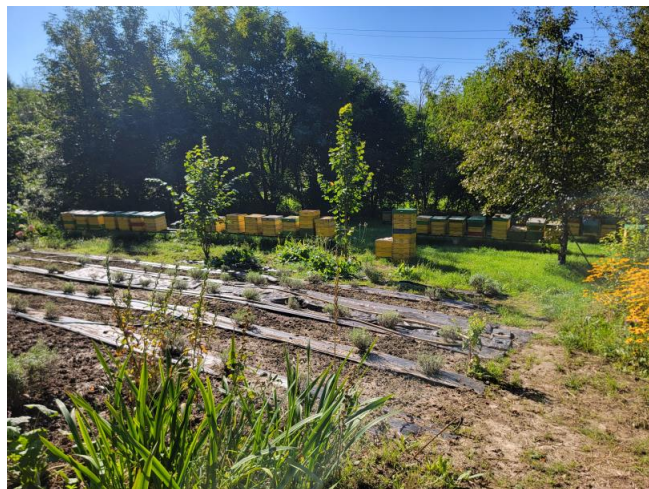
Sociální zemědělství v Polsku.

To vše vyžaduje, aby pečovatelský statek fungoval na základě stávajících organizačních forem jednotek sociální péče. To umožní svým způsobem automaticky splnit všechny požadavky kladené na tento typ zařízení. Z pohledu osoby, která zřizuje pečovatelský dům, se tedy jedná o výrazné zjednodušení - je výhodnější využít hotové modely než vytvářet od nuly instituci, jejíž fungování bude na každém kroku narážet na právní překážky. Využití aktuálně dostupných forem poskytování péče v rámci nevládních organizací nebo společností má ještě jednu důležitou výhodu. Tento koncept umožňuje využít dostupné zdroje financování tohoto typu zařízení. Máme tedy k dispozici finanční prostředky směřující do venkovských oblastí v souvislosti s rozvojem podnikání. V případě sociálních družstev je možné využít prostředky určené na rozvoj sociální ekonomiky. Rovněž je možné využít vládních a regionálních programů dotujících zřízení a provoz zařízení péče. Díky finančním prostředkům, které dostávají na péči ve svém hospodářství, mohou pečovatelé modernizovat své hospodářství, modernizovat své zemědělské činnosti nebo zahájit či rozvíjet další nezemědělské činnosti.