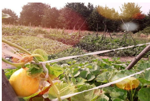
Sociální zemědělství v Česku.

Na Slovensku mají znevýhodněné osoby díky sociálnímu zemědělství možnost udržet si nebo zlepšit svůj zdravotní, sociální a psychický stav, začlenit se do společnosti nebo získat zaměstnání. Využívá zemědělské činnosti a prostředí farmy k terapii, rehabilitaci, sociální integraci, vzdělávání, integrovanému zaměstnávání a sociálním službám. Umožňuje zemědělcům diverzifikovat jejich příjmy získáním dalších zdrojů financování. Přestože je koncept sociálního zemědělství poměrně nový, služby, které zahrnuje, jsou v různých formách realizovány na místech po celém Slovensku. Zatím nemá oporu v konkrétním politickém nebo institucionálním rámci.