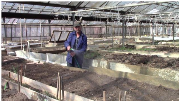
Sociální zemědělství na Slovensku.

Podpora zaměstnávání občanů se zdravotním postižením: a) Zákon č. 311/2001 Sb. Zákoník práce, b) zákon č. 5/2004 Sb. o službách zaměstnanosti. Úřad práce, sociálních věcí a rodiny vede zvláštní evidenci uchazečů o zaměstnání, kteří jsou občany se zdravotním postižením, a zájemců o zaměstnání, kteří jsou občany se zdravotním postižením. Zvláštní evidence obsahuje také údaje o poklesu schopnosti vykonávat výdělečnou činnost a údaje o právním důvodu, na základě kterého byli uznáni za občana se zdravotním postižením. Mezi zákonné povinnosti zaměstnavatele v uvedené oblasti patří zejména povinnost zajistit vhodné podmínky pro výkon práce občanům se zdravotním postižením, které zaměstnává, povinnost zajistit školení a přípravu k práci pro občany se zdravotním postižením a věnovat zvýšenou pozornost zvyšování jejich kvalifikace v průběhu zaměstnání a povinnost vést evidenci občanů se zdravotním postižením. Dalšími příspěvky pro zaměstnavatele, který zaměstnává občany se zdravotním postižením, jsou příspěvek na udržení občana se zdravotním postižením v zaměstnání, příspěvek na úhradu provozních nákladů chráněné dílny nebo chráněného pracovního místa a na úhradu nákladů na dopravu zaměstnanců, příspěvek na podporu zaměstnávání znevýhodněného uchazeče o zaměstnání a příspěvek občanovi se zdravotním postižením na samostatnou výdělečnou činnost.