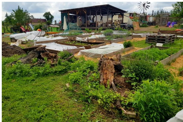
Sociální zemědělství v Česku.