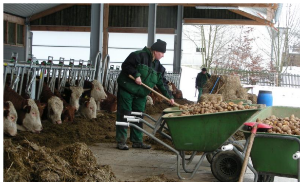
Sociální zemědělství v Německu.

Práce v dílně pro osoby se zdravotním postižením je pro ně zaručena zákonem. V minulosti mnoho dílen provozovalo vlastní hospodářství, aby se mohly zásobovat vlastními potravinami a to z důvodu stále těžší ekonomické udržitelnosti. Dnes je naopak motivem pro provozování farmy zajištění atraktivních pracovních míst, protože rozmanitost práce na farmě umožňuje širokou škálu smysluplných činností. Může to dojít tak daleko, že sociální organizace zakládají nové farmy, pokud se v zemědělství nenajdou partneři pro spolupráci.