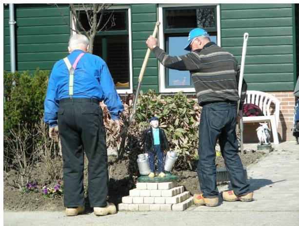
Mnoho farem v Nizozemsku nabízí denní péči o seniory trpící demencí® Thomas van Elsen