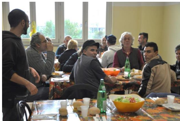
Sociální zemědělství v Itálii - Cooperativa Sociale Aretè.

Na státní úrovni se zákonem č. 141 ze dne 18. srpna 2015 s názvem "Ustanovení o sociálním zemědělství" uznávají a upevňují dosavadní zkušenosti se sociálním zemědělstvím, zavádějí se základní pojmy, vymezují se cíle, definuje se samotný pojem „sociální zemědělství“ a stanovuje se postup veřejné identifikace takových subjektů a určují se příjemce činností farmy. Zákon z roku 2015 tak podporuje sociální zemědělství "jako aspekt multifunkčnosti zemědělských podniků zaměřený na rozvoj sociálních, sociálně-zdravotních, vzdělávacích a sociálně-pracovních integračních služeb s cílem usnadnit přiměřený a jednotný přístup k základním službám, které mají být zaručeny osobám, rodinám a místním společenstvím na celém území státu, a zejména ve venkovských nebo znevýhodněných oblastech".