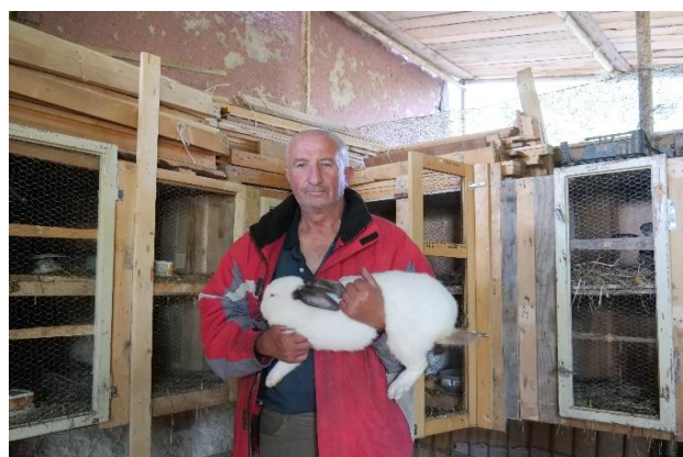
Sociální zemědělství na Slovensku.