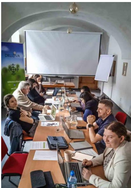
Setkání projektového týmu v Praze (15.11.2022), Rožňavě (28.3.2023) a Krakově (5.9.2023).

Společnost PETRARCA e.V. shromáždila národní zprávy z Česka, Slovenska, Polska, Itálie a Německa a na základě těchto informací zpracovala tuto souhrnnou mezinárodní zprávu.